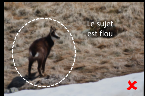
Le sujet est flou