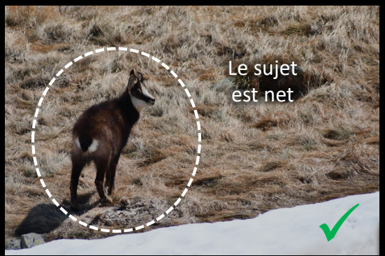
Le sujet est net