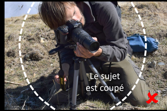
Le sujet est coupé