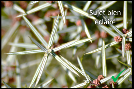
Sujet bien éclairé