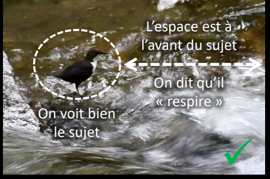
L'espace est à l'avant du sujet