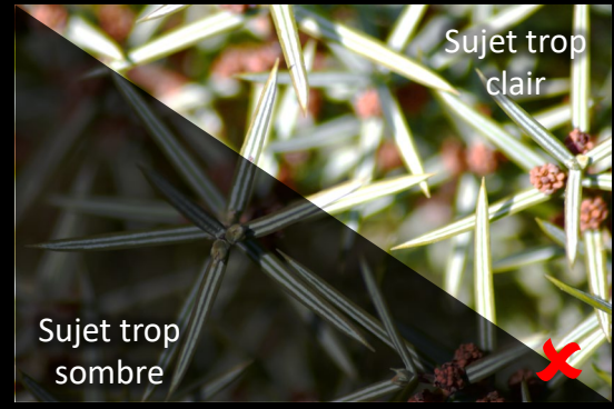
Sujet trop clair