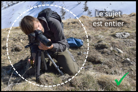
Le sujet est entier